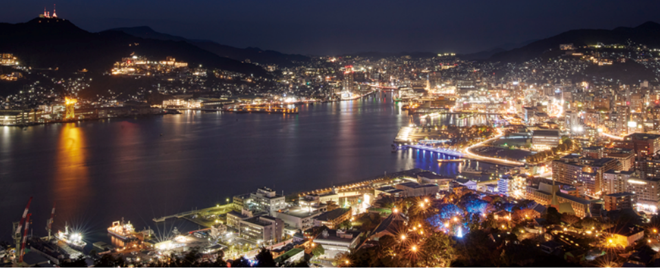
なべかんむりやま 鍋冠山公園

稲佐山の真正面から見た長崎の夜景を楽しめるのが、標高169mの鍋冠山。グラバー園の背後の高台にあたり、広い展望台も備わる。市街地の明かりが近く、より立体的に見える。