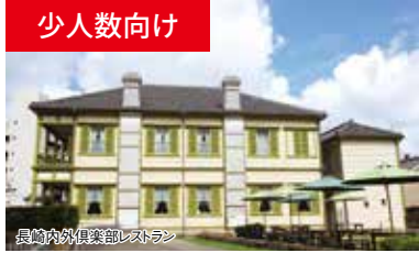
長崎内外倶楽部レストラン