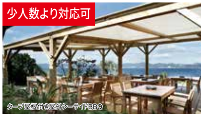
ターフ景観の島外シーサイドBBQ