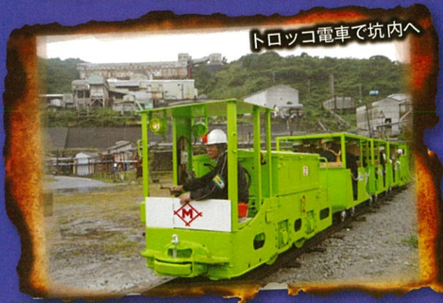
トロッコ電車で坑内へ

池島は、西彼杵半島の長崎市外海(そとめ)の沖合西7キロに浮かぶ、周囲4キロの小さな島です。この島には、九州で最後まで残った炭鉱「池島炭鉱」がありました。池島炭鉱は昭和34年に開業し、その後坑道総延長約90kmの巨大海底炭鉱へと発展しましたが、エネルギー革命の波に抗しきれず、残念ながら平成13年に閉山しました。その坑道跡を長崎市の産業遺産として、広く一般の皆様にご公開するツアー参加者を募集しています。皆様多数のご参加をお待ちしております。