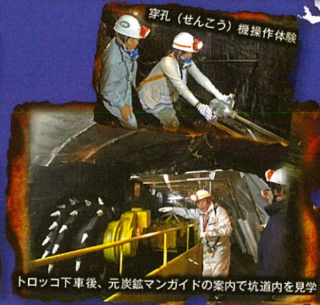
トロッコ下車後、元炭鉱マンガイドの案内で坑道内を見学