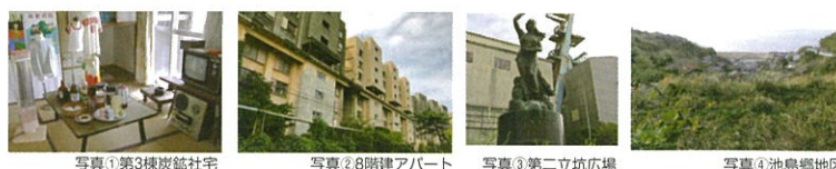
写真①第3棟炭鉱住宅 写真②8階建アパート 写真③第二立坑広場 写真④池島郷地区

定員20名 最少催行1名(島内各所を歩いて回ります。途中階段の登り降りもあります。) (詳細は三井松島リソース株式会社TEL:0959-26-0888へお問合せ下さい。) 復路は池島港15:47発高速船(この場合、帰りは「池島郷東バス停」よりバス乗車になります)又は、17:00発フェリーとなります。