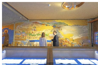
日本二十六聖人記念館での導入

布教、殉教、潜伏の歴史の中で育まれた精神や文化が残る地域、外海・出津・黒崎地区。「知識が景色を変えていく」では、モデルコンテンツを通して、過去の歴史から日本におけるキリスト教精神と文化体験により「自身の価値観の変化」に繋げてもらうプランです。