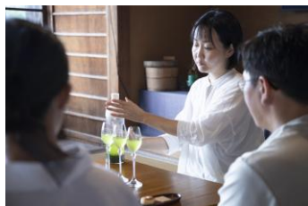
長崎らしい景観を眺めながら 古民家で日本茶体験