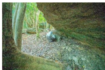
枯松神社での祈りの体験