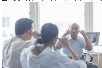
被爆者からの継承体験