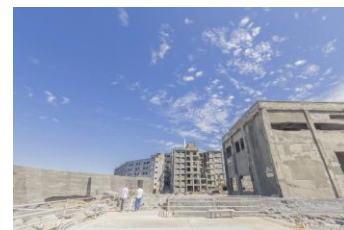
軍艦島上陸クルーズ体験