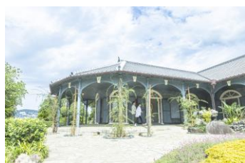
グラバー園での導入

ヨーロッパと中国の文化を受け入れて混じり合い、独自の進化を遂げた、日本でもここ長崎にしかない文化や風習。長崎の発展の歴史と悲劇を追体験しながら、この場所に暮らす人々の想いを体感し、未来に繋いでいく一員になってもらうプランです。