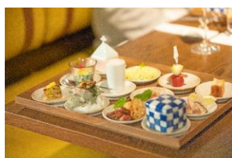
ホテルでのディナー&amp;宿泊