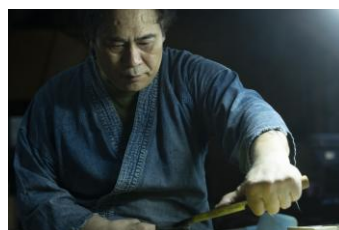
桑原鍛冶工房での蚊焼庖丁体験