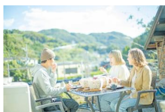
出津農楽舎でのかんころ餅づくり体験とランチ