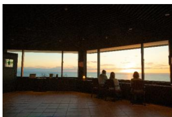
遠藤周作文学館・思索空間 アンシャンテでの振り返り