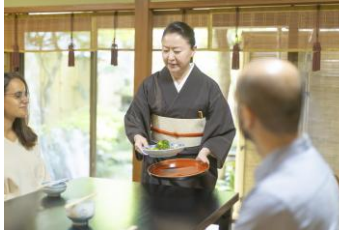
長崎流の日本食・文化体験