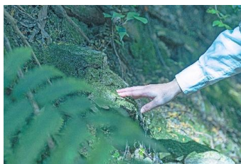
バスチャン屋敷での瞑想体験